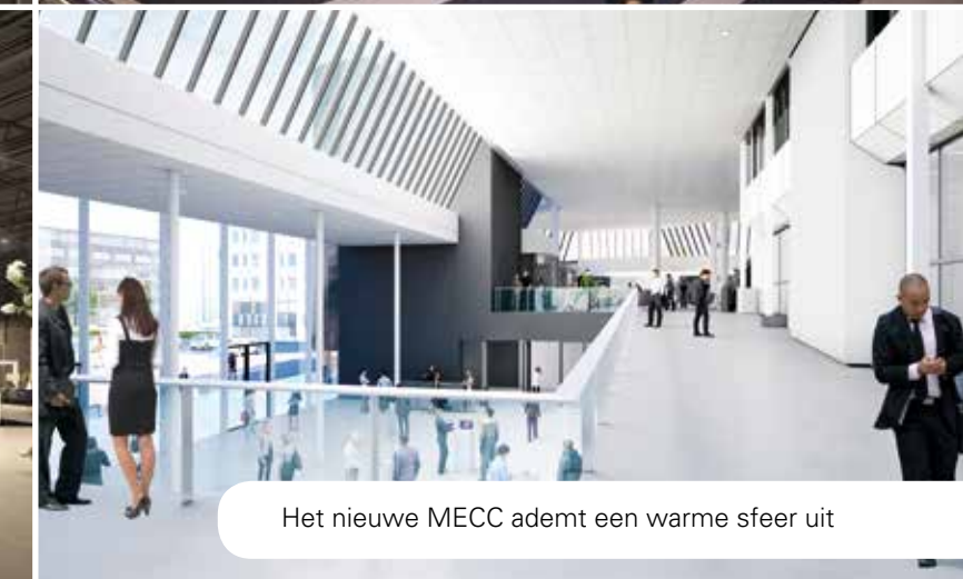
Het nieuwe MECC ademt een warme sfeer uit

samen als team. Dat kun je niet alleen.”